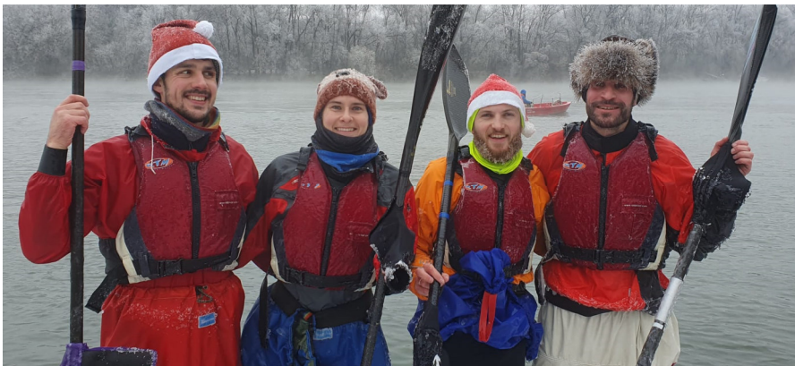
Bild 25 Paddler on the rocks

Stolz im Ziel angekommen, überdeckt von einer dicken Eiskruste, freuten sich dann alle gleichermaßen auf eine warme Mahlzeit, Dusche und nette Gespräche im Vereinsheim. Während nun die fleißigen Frostbeulen ihren Weg aus der heißen Dusche gefunden hatten, erwartete man sie bereits mit einem riesigen Topf Chili Con Carne, Brot und weihnachtlich duftenden Waffeln mit Sahne.