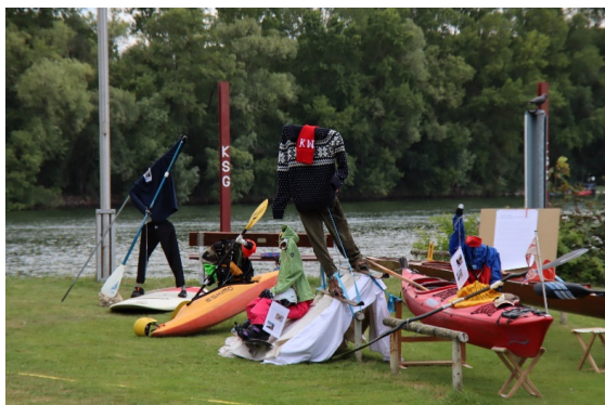
Bilder 13 und 14 Rahmenprogramm und Kinderunterhaltung