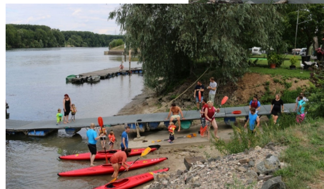
Bild 18 Das ORGA-Team war sichtlich zufrieden