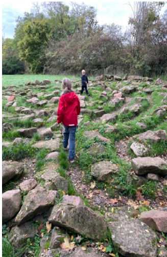
Bild 36 Über Stock und Stein

Angekommen bei der Flörsheimer St. Anna Kapelle ging es mehr als 50 Stufen die Treppe abwärts bis zum Gasthof Wiesenmühle - Endlich Essen. Aber danach mussten wir wieder die Treppe hoch - und das mit vollem Bauch. Oben steht man dann vor mehreren Fernrohren. Wenn man da reinschaut, sieht man bekannte Sehenswürdigkeiten aus der ganzen Welt. Ein Stückchen weiter steht der Eisenbaum. wieder Treppe hoch, aber man hat eine schöne Aussicht. Von hier aus war es nicht mehr weit zu unserem Ausgangspunkt. Es war mal wieder ein schöner Ausflug, auch wenn es manchmal etwas laut war, wegen der hier recht tief fliegenden Flugzeuge.