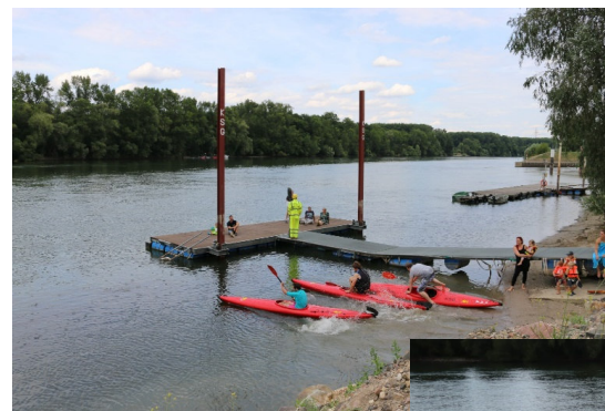
Bilder 15, 16 und 17 Kleine, spontane Regatta mit Kinderbootsfahrt