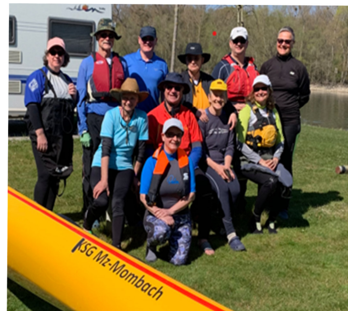
Bild 1 Anpaddeln bei sonnigem Wetter