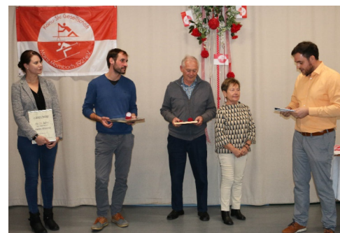
Bilder 26, 27, 28 und 29 Jubilare und ausgefuchste Gewinner

Ein ebenfalls schönes und fest eingeplantes Event ist unser jährliches Herbstfest. Hier bietet sich die Möglichkeit unsere verdienten Mitglieder zu ehren, die vergangene Saison Revue passieren zu lassen und neue Pläne für das nächste Jahr zu schmieden.