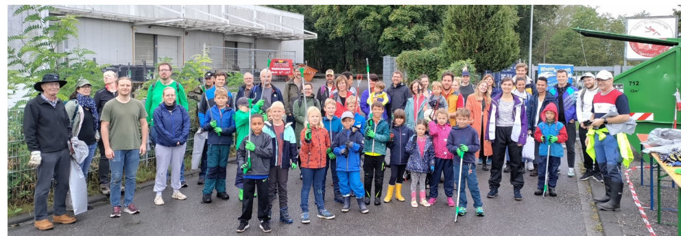
Bild 19 Gesamte RCU-Helfermannschaft