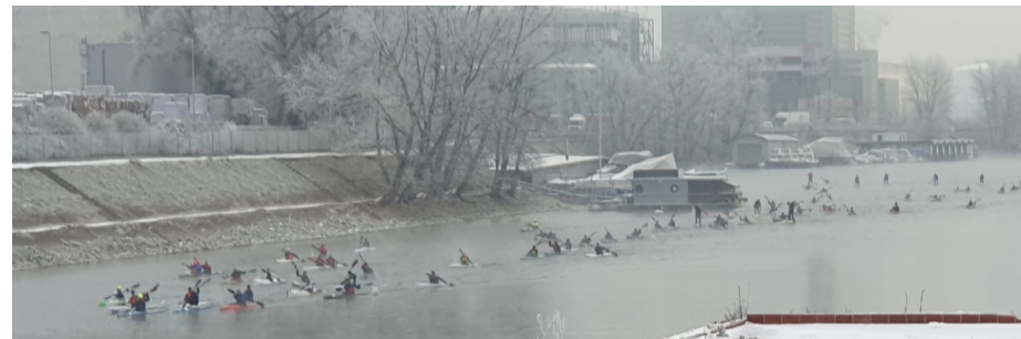
Bild 22 Start im Hafen

Für all diejenigen, die in der kalten Jahreszeit den weihnachtlichen Leckereien vorbeugen oder diese abtrainieren wollen, ist es den Wintercup Veranstalter auch 2022 gelungen eine Trainingsserie anzubieten. Gefroren, gezittert, geschwitzt, gekämpft, gelacht und vor allem gepaddelt wurde diesen Winter in Herdecke, Mainz, Köln und in Venlo.