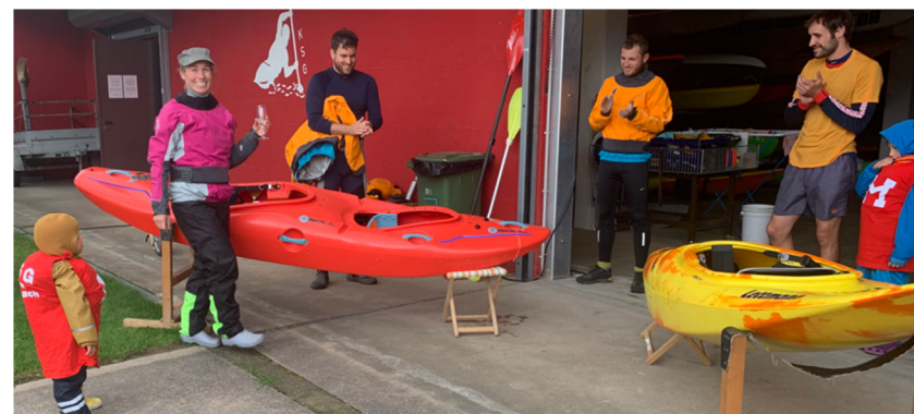
Bild 4 Bootstaupe vor der Rettbergsaue-Umrandung

Eine Woche später am 25.09.2022 fuhren 3 Teilnehmer von der KSG, und 2 Freunde aus Bad Kreuznach nach Guntersblum, zum KVR-Abpaddeln. Da das Hofgut Langenau, leider kein Ausflugsziel mehr ist, legten wir zur Rast 200m unterhalb an. Nach einem 2. Zwischenstopp beim MKV, machten wir uns auf das letzte Stück nach Mombach auf. ➤