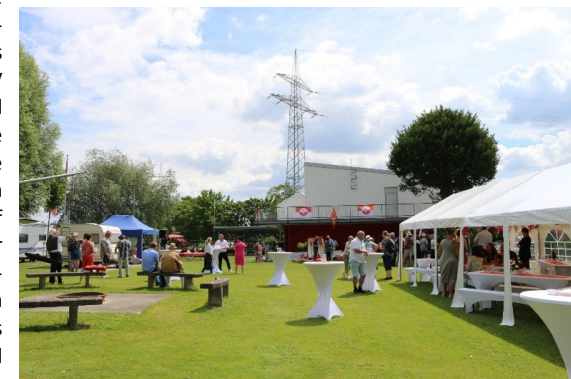
Bilder 6 und 7 Danke den Wühlmäusen für die herzliche Arbeit am Bootshausgelände

kommen wird. Mit Freude wurde die Vertreterin des DKV Isa Winter-Brand begrüßt und folgend das Wort übergeben. Auch der DKV ehrte unseren sportlichen und gesellschaftlichen Einsatz. Die aktuellen Projekte rund um eine Wildwasserstrecke in Rhein-Main und deren Unterstützung fielen auf offene Ohren bei den Mainzer Paddlern. Eine gläserne 100-Jahr-Plakette und ein Ausbildungsbuch wurden überreicht. Als nächstes sprach Klaus Kuhn vom Sportbund Rheinhessen über das Ehrenamt, die Trainer und Jugendleiter.