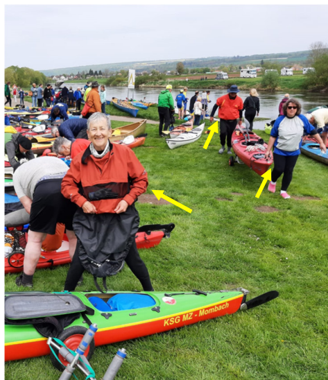
Bild 3 Ausstieg Holzminden, Wesermarathon

➤ Am 06.08.2022 paddelten 5 Paddler auf der Lahn 20 km von Runkel zur Diezer Paddlergilde. Nach den ersten 10 km legten wir bei Limburg unsere Mittagspause ein und besuchten das Restaurant „Obermühle“. Bevor wir unser Ziel erreichten, passierten wir noch die Schleuse bei Limburg und Dietz. Bei eisigen Temperaturen trafen wir uns am 18.09.2022 zum Abpaddeln bei der KSG.