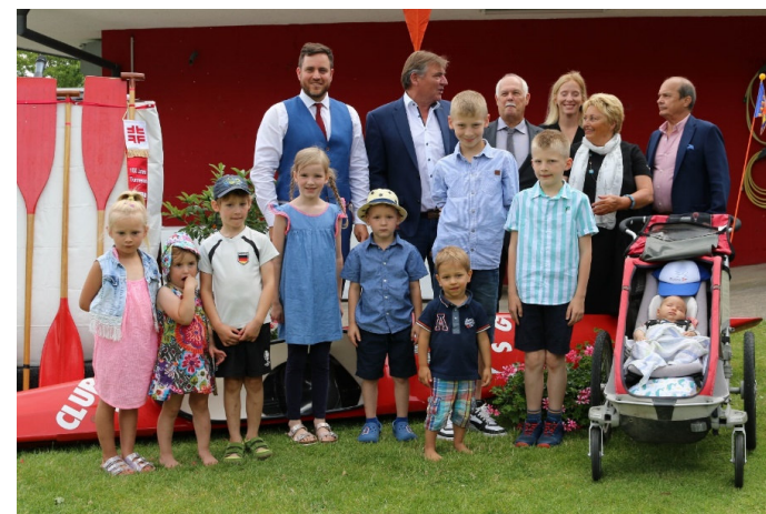
Bild 12 Die Zukunft der KSG im Vordergrund

Bei einer unzähligen Auswahl von Motiven fand am Ende jeder das richtige für sich. Für die sportliche und erheiternde Komponente sorgte eine spontan organisierte Kleinregatta. Jeweils drei Sportler mussten per Landstart in die baugleichen Boote einsteigen, einmal um die nahe gelegene Boje fahren und zurück zur Rampe gelangen. Neun Mutige fanden sich, sodass erst die drei Vorläufe und dann die drei Finalläufe ausgefahren wurden.