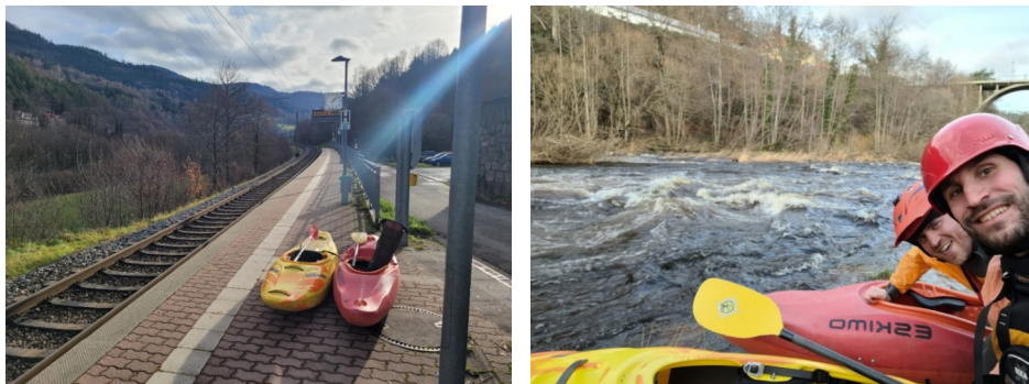
Bilder 30 und 31 Umsetzen per Bahn und dann aufs Wasser