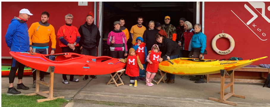
Bild 2 Abpaddeln bei eisigen Temperaturen. Nur die Harten kommen in den Garten

eine Ramazotti Pause ein. Am Bootshaus wieder angekommen, gab es zum Abschluss, in geselliger Runde leckeren Kaffee und Kuchen. An den Rheinbefahrungsregeln am 03.04.2022 in Oppenheim haben 2 Mitglieder teilgenommen. Es wurden die Grundlagen und das sichere Verhalten auf dem Rhein vermittelt. Am 01.05.2022 fand wieder zwischen Hannoversch Münden und Hameln der Wesermarathon statt. Mit 6 Paddlern sind wir schon am Freitag angereist. Von den 3 Strecken 53 km, 80 km und 135 km entschieden wir uns für die Kürzeste. Nach 7 Std. hatten wir unser Ziel, Beverungen erreicht.