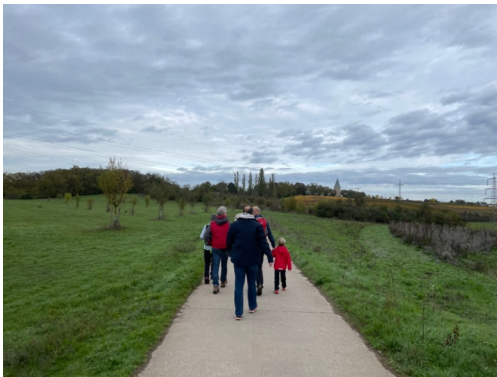
Bild 37 Das Ziel ist der Weg

Bei der diesjährigen Herbstlichen Einkehr am 23.10.2022 waren wir zu siebt unterwegs, diesmal auch mit 2 Kindern. Gestartet zu unserem 7,5 km langen Ausflug, sind wir in einem Stadtteil von Flörsheim, Keramag/Falkenberg. Nach der Überquerung des Wickerbachs kamen wir zu den Überresten der historischen Kalköfen. Ihre Geschichte geht bis ins 18. Jahrhundert zurück. Die Anlage lieferte die Grundlage für den Kalkputz für viele Flörsheimer Häuser. Vermutlich brannten hier aber schon die Römer in grauer Vorzeit Kalkgestein. Kurz hinter der kleinen Kriegerkapelle kam dann was Interessantes für die Kinder: Ein Steinlabyrinth. Weiter ging es zur Flörsheimer Warte. Hier bot sich eine Gelegenheit zu einem kleinen Pauschen, um Getränke oben rein und unten auch wieder rauszulassen. Unsere Wanderung führte uns weiter durch Weinberge und Wiesen. Auf einer Wiese hat unser jüngster Wanderer sogar noch einen Fuchs entdeckt.