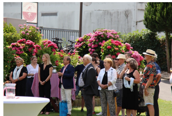
Bilder 11 Gespannte Gäste

Zusätzlich für die Mittagsstunden war eine Künstlerin eingeladen worden. Hier wurden professionelle Tattoos auf die verschiedensten Körperteile von Jung und Alt gezaubert.