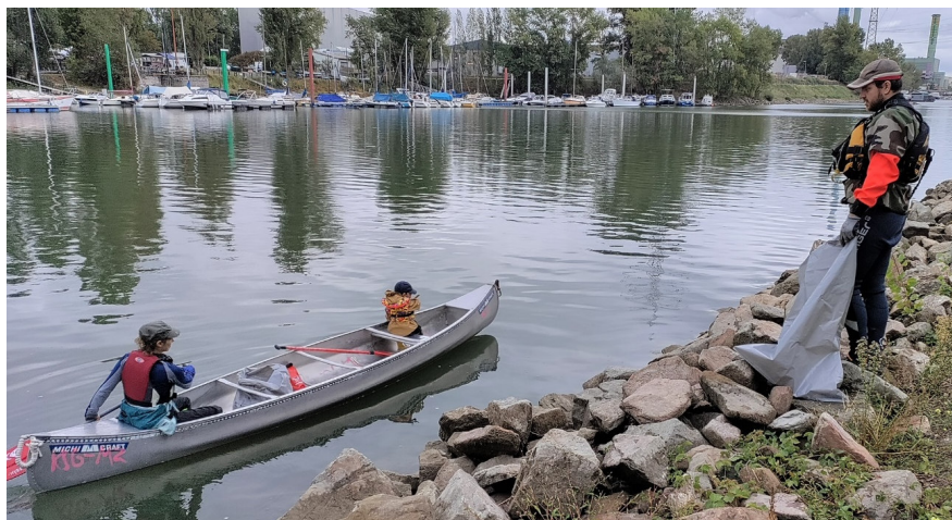
Bild 21 Auch im Hafen wurde geputzt